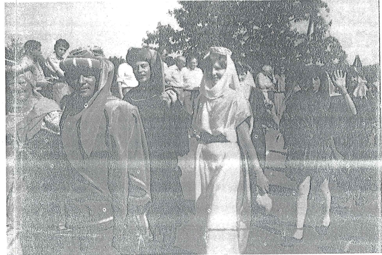
Une cinquantaine de Cellariens costumés ont défilé dans les rues de Langforden.

14 juillet 1989-13 juillet 1990 : deux dates à retenir dans l'histoire du jumelage Langforden-Le Cellier. L'an passé, les Cellariens avaient profité du bicentenaire de la Révolution pour sceller officiellement les liens qui les unissent désormais à la commune jumelle allemande. Cette année, c'est à l'occasion du jubilé de cette dernière qu'a été signée la charte du jumelage outre-Rhin. L'occasion aussi pour quatre-vingt-dix habitants de la commune de participer activement à la « Volkfest », la fête populaire annuelle de Langforden.